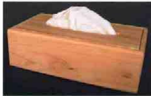
ティッシュボックス

材質:檜 処理:クリヤー塗装 サイズ L:230 W:150 H:190 小物入れとしてもオシャレです